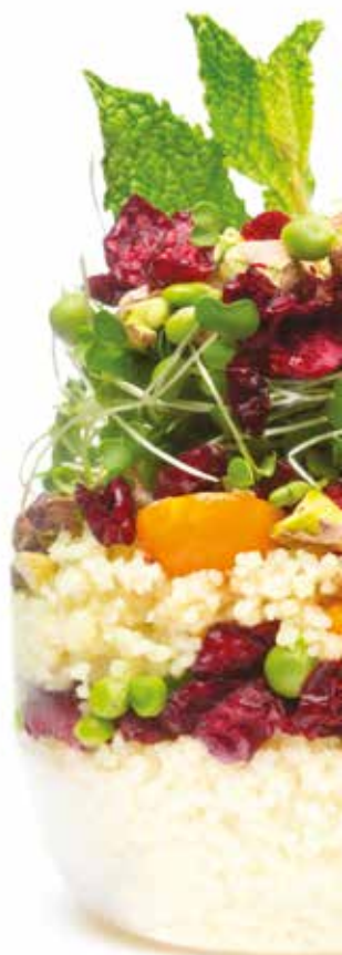
COUSCOUS CANNEBERGE À L'ORANGE nutra-fruit.com