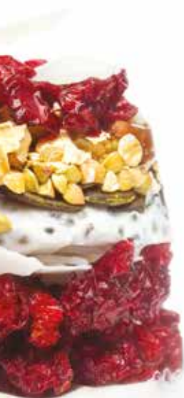
YOGOURT GRANOLA & CANNEBERGE nutra-fruit.com